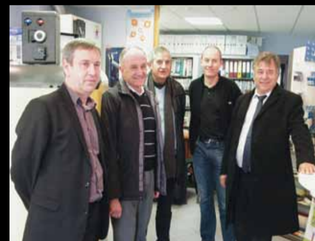
Visite de l'entreprise QUINIO-CARRIOU, plombier-chauffagiste.